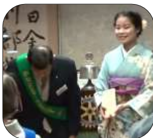
ロータリー 米山記念奨学金贈呈