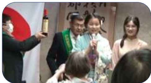
ニャンさん・ゲンチャンさんからのプレゼント披露